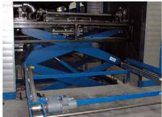
Um eine sichere Übergabe des Warenträgers auf den Kettenförderer zu gewährleisten, ist der Hebetisch mit einer Bolzenverriegelung ausgestattet. Die Isolierung ist hier zur besseren Ansicht demontiert