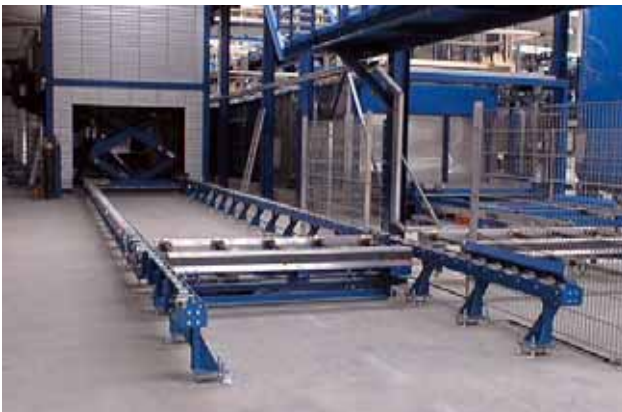
Hebetisch in einer KTL Lackieranlage in einem A-Schleusen Trockner. Der Oberrahmen ist mit Tragkettenförderer ausgerüstet. Zum Schutz vor der Hitze im Trockner ist der Oberrahmen des Hebetisches isoliert.