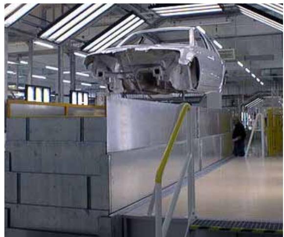
Hebetisch in einer Lackieranlage. Blechverkleidung 3-fach teleskopierend zur Absicherung von Quetsch- und Scherstellen