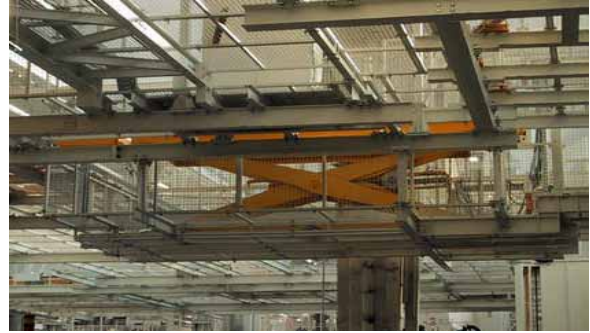
Hebetisch im Schlittentrücktransport einer Automobilfabrik